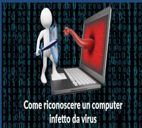
Come riconoscere un computer infetto da virus